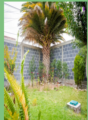
MURO PERIMETRAL: JARDÍN DE NIÑOS "VASCO DE QUIROGA" LORETO