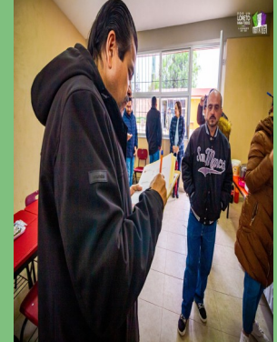
CONSTRUCCIÓN DE AULA EN LA ESCUELA PRIMARIA "MIGUEL AUZA" EN LA COLONIA LOS PUENTES, LORETO