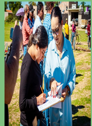
CONSTRUCCIÓN DE LÍNEA ELÉCTRICA E INSTALACIÓN DE EQUIPO DE BOMBEO PARA POZO EN BIMBALETES