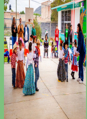
MURO PERIMETRAL: JARDÍN DE NIÑOS "MARÍA MONTESORI", LORETO