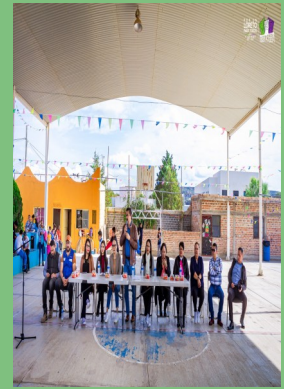
MURO PERIMETRAL ESCUELA PRIMARIA "RICARDO FLORES MAGÓN" COLONIA REVOLUCIÓN